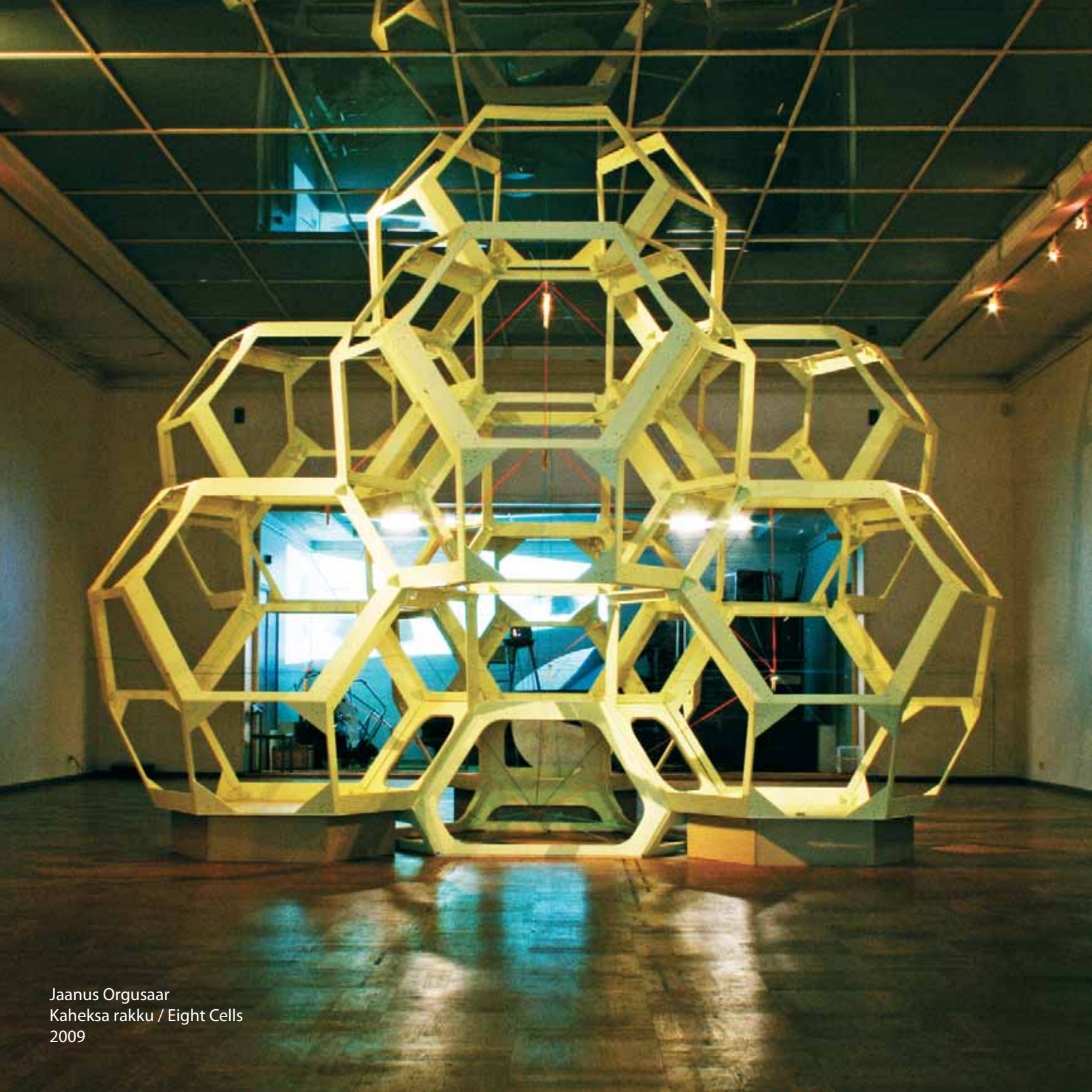
Jaanus Orgusaar Kaheksa rakku / Eight Cells 2009