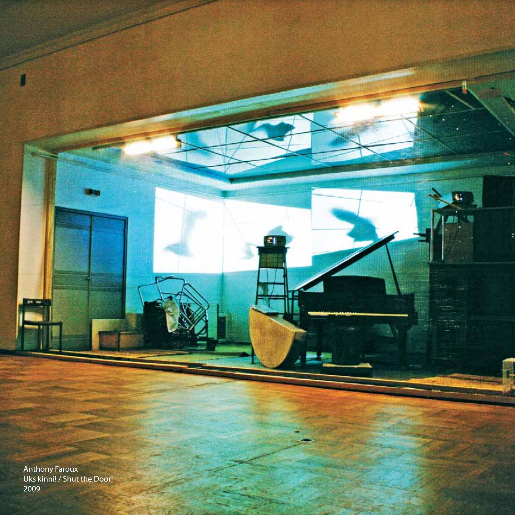
Anthony Faroux Uks kinni! / Shut the Door! 2009