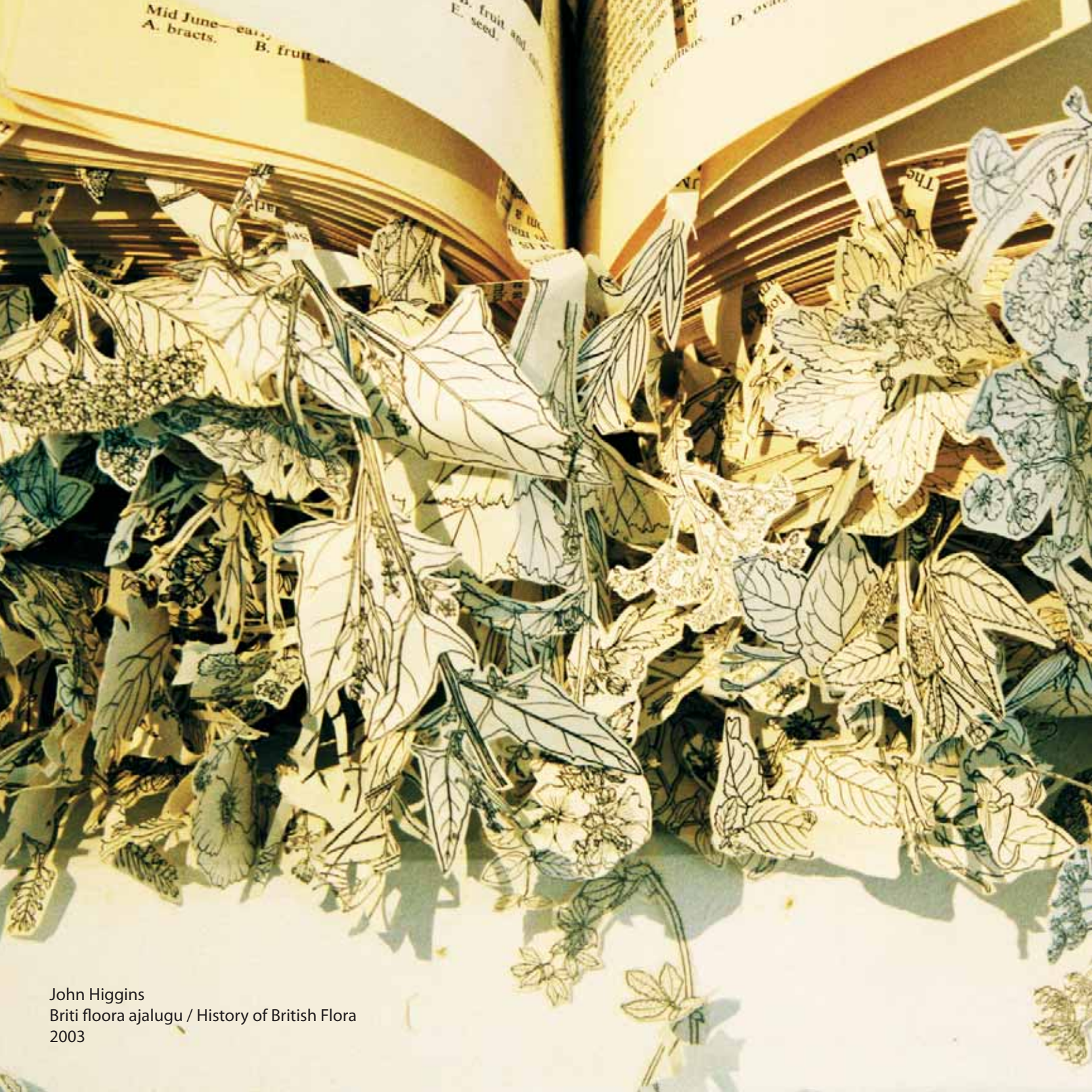
John Higgins Briti flora ajalugu / History of British Flora 2003